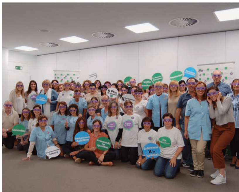
El II Plan comprende 85 acciones diferentes

Se insta así para los años 2012-2017, un "Primer Plan de Igualdad de SATSE Euskadi", predecesor de este Segundo Plan, cuya valoración general ha sido satisfactoria.