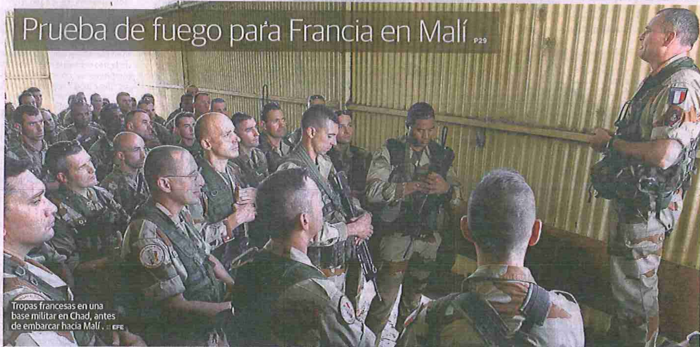
Tropas francesas en una base militar en Chad, antes de embarcar hacia Malí.