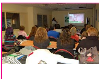
Curso Intervención en Violencia de Género