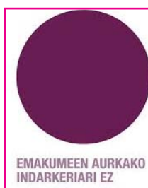
Punto lila. Día Contra la Violencia hacia las Mujeres