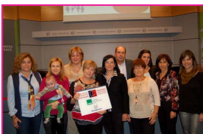
Reconocimiento como Entidad Colaboradora en Igualdad de Oportunidades entre Mujeres y Hombres por Emakunde.