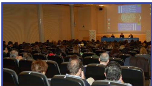
II Certamen de Investigación

- Subvención para la realización del curso "El agua como medio de preparación al parto" para matronas.