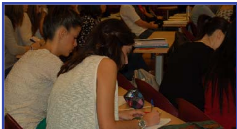
Curso preparación examen EIR