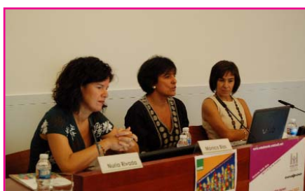
Participación en las jornadas de Emakunde: "Nuestro cuerpo, nuestros derechos" de Emakunde