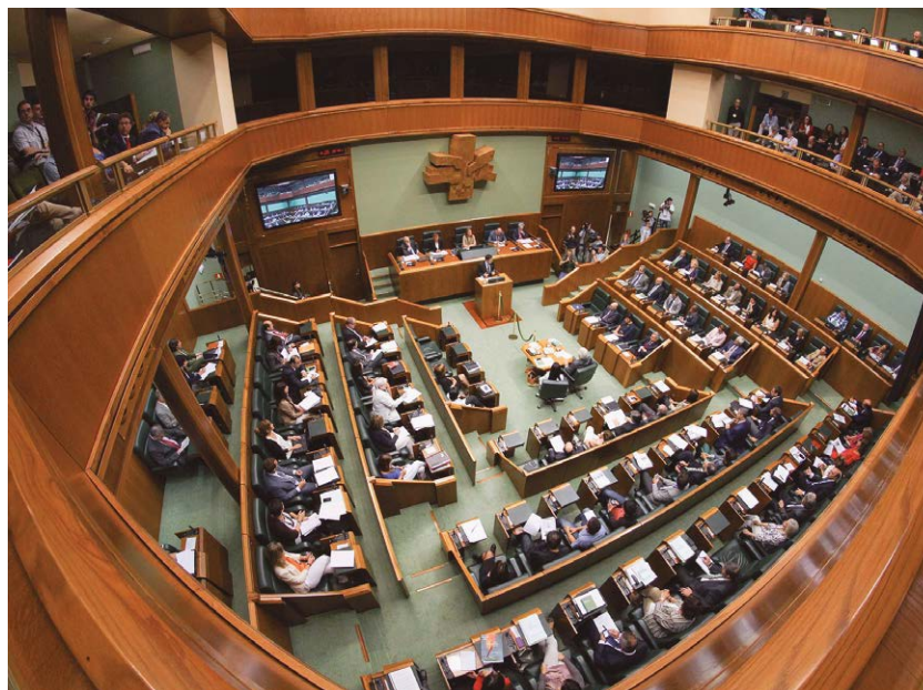
SATSEk lanbidearen errealitatea hurbiltzen die gure ordezkariak eta konpromisoak eskatzen ditu

SATSEk ondoko erronka nagusiak ezarri ditu datoren urteetarako; arreta instituzional handiagoa lortzea eta Erizaintzarako eta Fisioterapiarako baliabideetan inbertsio han-